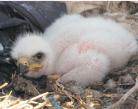
Беленький пушистый комочек, но взгляд уже орлиный! Будущему хозяину степи – несколько дней

Гнезда с кладками и птенцами (расположенные на земле или небольших кустах) часто сгорают в степных пожарах. Но одно из найденных нами гнезд погибло не в пожаре. Его сожгли (вместе с птенцами!), для того, чтобы развести костер. Местное население с почтением относится к орлам, и этот вандализм не объясним.