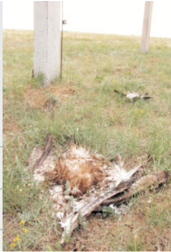
... и множество погибших орлов ежегодно остаются лежать под столбами

Гнезда с кладками и птенцами (расположенные на земле или небольших кустах) часто сгорают в степных пожарах. Но одно из найденных нами гнезд погибло не в пожаре. Его сожгли (вместе с птенцами!), для того, чтобы развести костер. Местное население с почтением относится к орлам, и этот вандализм не объясним.