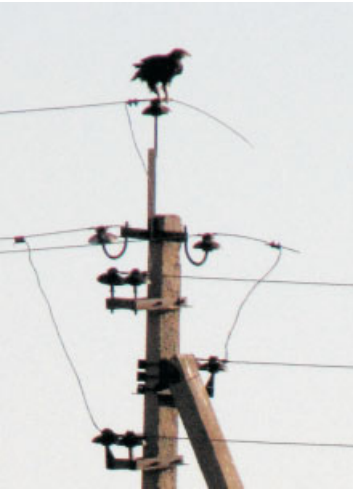
Удобно осматривать степные владения с высокой опоры ЛЭП...

возле границы заповедника было обнаружено 6 погибших орлов. Погибают в первую очередь молодые птицы во время пролета и кочевок. Но масштабы гибели этого редкого вида потрясают!