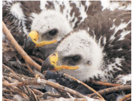
А эти орлята подросли, пух уже сменяется темными перьями, но до первых полетов еще далеко

Полевые работы по проекту продолжаются, затем предстоит обработка и анализ собранных данных, поиск путей решения проблем. Мы еще расскажем об итогах проекта.